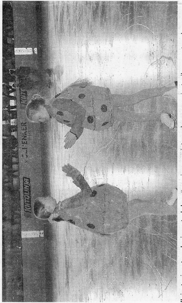
Iloiset pienet sadepisarat yhdessä auringonpaisteen kanssa saivat aikaan sateenkaaren.