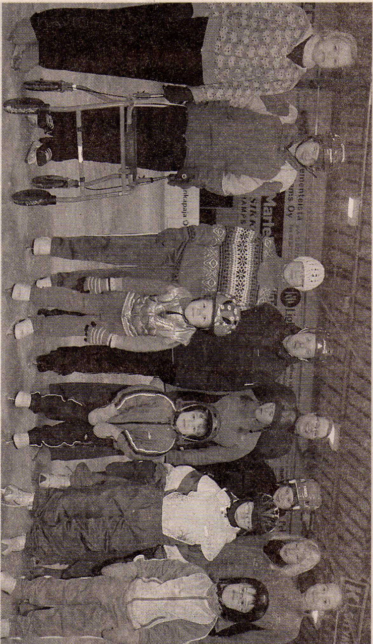
Soveltavan luistelun ryhmä Myllyt ehti harjoitusten lomassa poseeraamaan toimintajälle. Ryhmän henki on hyvä, luottavainen ja avoin.

Myllyt-ryhmässä kaikki ovat tervetulleita jäälle Soveltavan luistelun ryhmä antaa tilaa erilaiselle oppimiselle eikä taitovaatimuksia ole