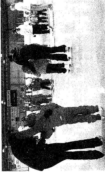
Miniluisteluun voivat tulla kaikki yli 4-vuotiaat lapset. Luistelukokemuksista ei tarvita. Ohjaajia oli pienempien ryhmässä monta, jotta vasta luisteluun tutustuivat lapsetkin saatiin turvallisesti jalle.

Vihdin Taitoluistelijat on Suomen Taitoluisteliiton jäsen. Seuran toimintaa pyörittävät vapaaehtoisvoimin. -to