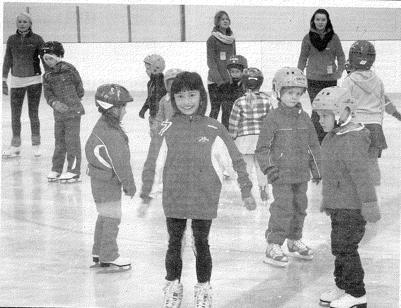
Sä kätes ojenna, ja taakse taivuta, sitten huugi-wuugi tee ja pyöri ympäri... Luistelukoululaisten ensimmäinen harjoitus alkoi tutulla Fröbelin Palikoiden laululeikillä.

– Luistelukoulussa ollaan yhdestä kolmeen vuotta,