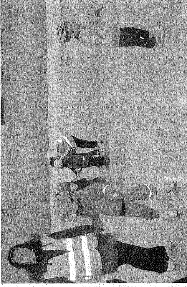
Miniluistelukoulussa tarvitaan monta apuohjaajaa, kun osa luistelukouluista on aivan ensimmäistä kertaa jäällä.