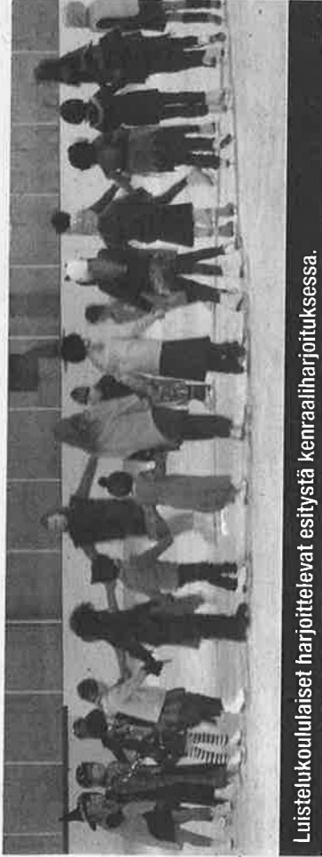
Luistelukouluaiset harjoittelevat esitystä kenraaliharjoituksessa.