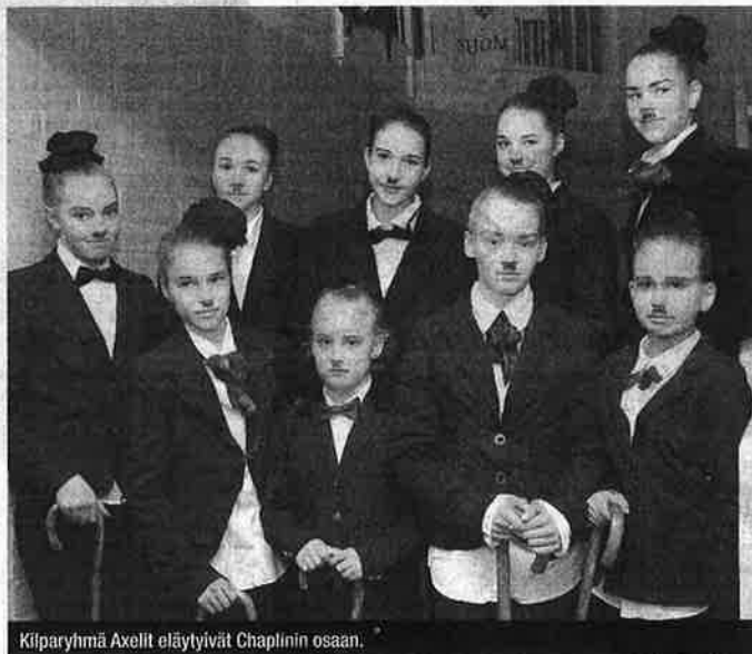
Kilparyhmä Axellit eläytyivät Chaplinin osaan.

koi vuonna 1997, kun vantaalainen seura Hopeatärät toi lajin paikallakunnalle. Toukuuussa 2000 perustettiin Vihtiin oma seura Vihdin Taitoluistelijat ry eli VTL.