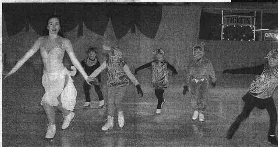
Tuhkimon tarinan kertoi Tulppit -ryhmä.

Kirsikkana kakun päällä esityksessä nähtiin muodostelmaluistelun tuore 14-19-vuotiaiden vuoden 2013 maailmanmestari Musketters. Ryhmä lähti mu-